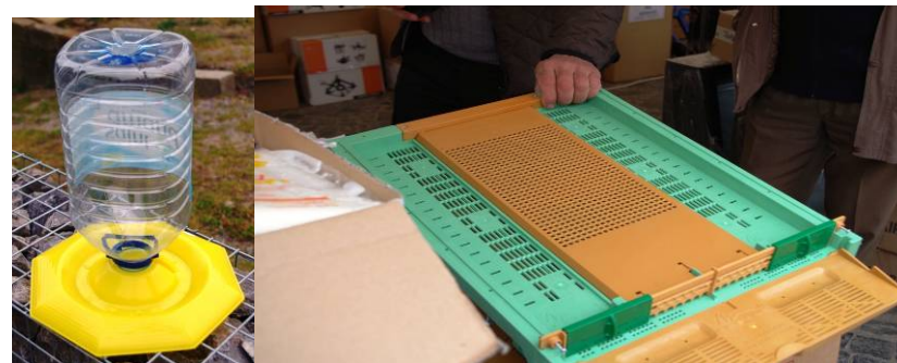
Abreuvoir 5L Piège à pollen de plancher