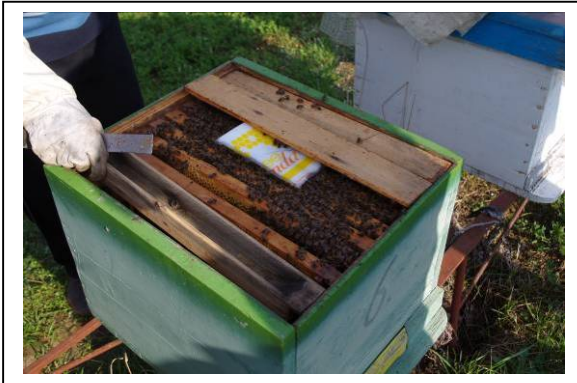
Nourrisseur cadre (bois évidé) et candi

Nous avons aussi visité des apiculteurs locaux. Les colonies sont des Dadant 10 cadres HOFFMAN avec 6 cadres occupés. Il faisait encore frais la nuit.