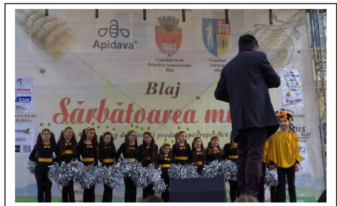
Remplissage à main par piston doseur