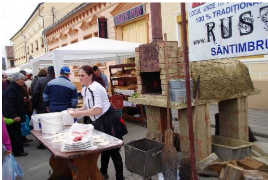
Le four à pain, construit la nuit du marché !

conférences apicoles à la mairie, des animations...la voiture (célèbre Fiat Polski de l'époque communiste) qui sillonne l'Europe avec la pétition contre les néonicotinoïdes...Nous étions aussi l'attraction des TV nationale et privée.