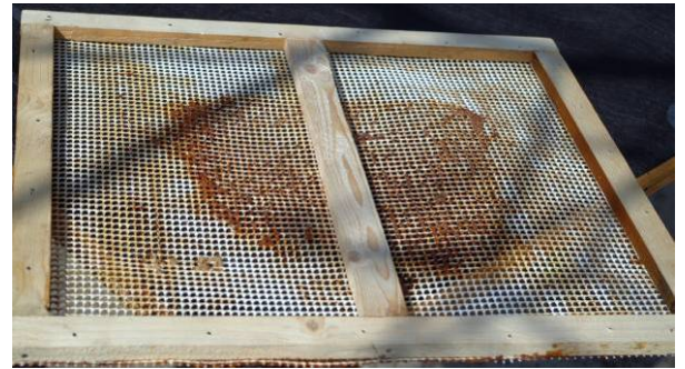
Filet à propolis à maille de 3mm en nylon

Nous avons aussi visité des apiculteurs locaux. Les colonies sont des Dadant 10 cadres HOFFMAN avec 6 cadres occupés. Il faisait encore frais la nuit.